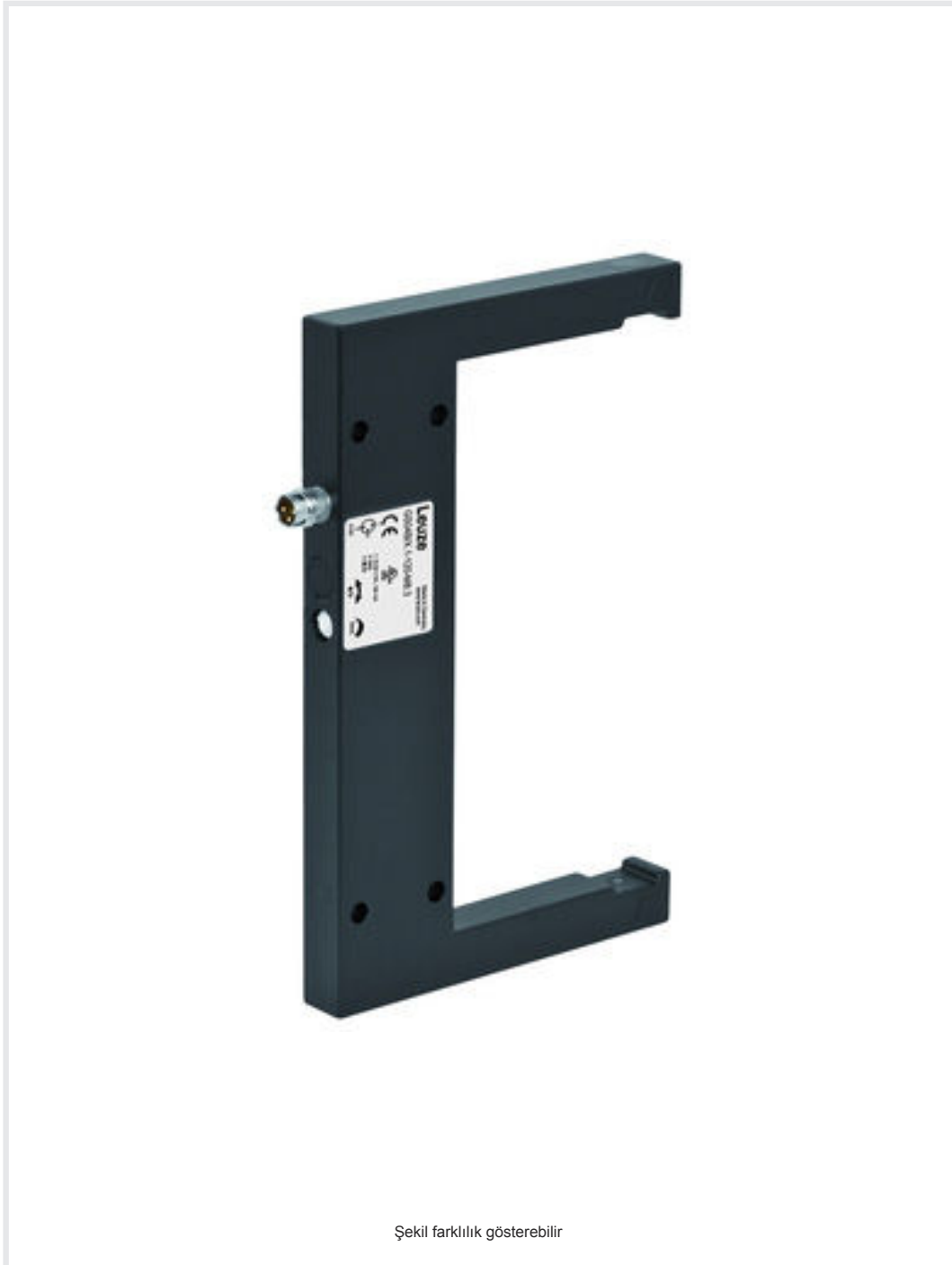
Şekil farklılık gösterebilir